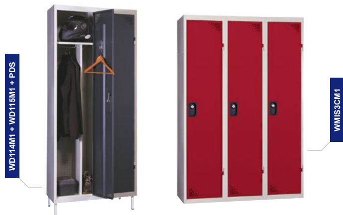
WD114M1 + WD115M1 + PDS